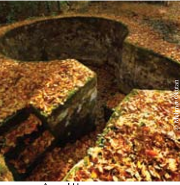
Ayvad Havuzu, Belgrad Ormanı İstanbul, 1765