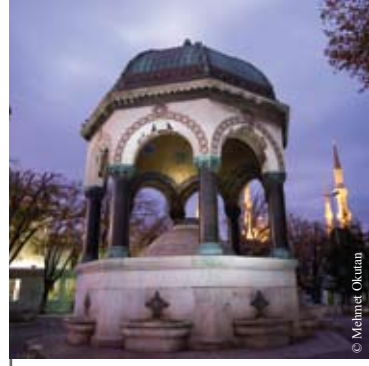
Alman Çeşmesi, Sultanahmet İstanbul, 1765

Birinciye 15,000 $, ikinciye 10,000 $, üçüncüye 5,000 $ ödül verilecektir.