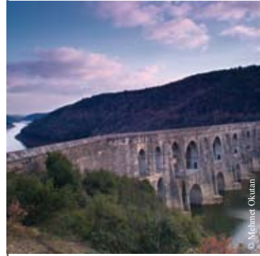
Mağlova Su Kemer, Alibeyköy İstanbul, 1562

Özel ülke gruplarından biri olarak, MENA/Arap ülkeleri bölgesi, Arap Su Konseyi'nin koordinasyon altında çalışmalarını tamamlamaktadır. 2008 Kasım ayında Suudi Arabistan'da düzenlenen Arap Su Forumu, MENA/Arap ülkeleri bölgesel sürecinin sonuçlarını içermiştir ( Region-Mena-ArabCountries@worldwaterforum5.org ). Akdeniz bölgesel hazırlık süreci Akdeniz Su Enstitüsü'nün koordinasyon altında oluşturulmuştur. Akdeniz bölgesel oturumu içerisinde Akdeniz bölgesine özgü farklı konuların tartışılacağı bir panel de yer alacak ( Region-Mediterranean@worldwaterforum5.org ). 5. Dünya Su Forumu'na ev sahipliği yapan Devlet Su İşleri ise, Türkiye içi ve çevresi bölgesi için koordinatör kurum olarak çeşitli toplantılar düzenlemiştir ( Region-Turkey@worldwaterforum5.org ).