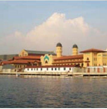
Sütlüce Kongre Merkezi