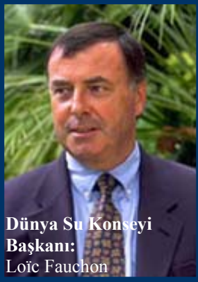
Dünya Su Konseyi Başkanı: Loïc Fauchon

Dünya Su Konseyi (WWC) uluslararası ve çok paydaşlı bir platformdur. 1996 yılında su alanındaki ünlü uzmanların ve uluslararası kuruluşların girişimiyle uluslararası topluluğun su meseleleri konusunda artan kaygılarına yanıt vermek üzere kurulmuştur. Dünya Su Konseyi'nin misyonu “Dünya üzerindeki bütün canlıların yararına çevresel bir sürdürülebilirlik temeli üzerinde suyun bütün boyutlarıyla etkili bir şekilde korunması, geliştirilmesi, planlanması, yönetimi ve kullanımını kolaylaştırmak için en üst düzey karar mercileri dâhil, bütün düzeylerde farkındalık yaratmak, siyasi sorumluluk oluşturmak ve kritik su