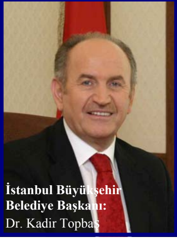
İstanbul Büyükşehir Belediye Başkanı: Dr. Kadir Topbaş

İstanbul Büyükşehir Belediyesi, Roma İmparatorluğu'nun, Bizans'ın ve Osmanlı İmparatorluğu'nun eski başkenti olan; Türkiye ekonomisinin ve sosyo-kültürel hayatın kalbi konumunda ve 12 milyondan fazla nüfusa sahip İstanbul şehrinin yerel yönetimidir. Yönetimin en üst düzeyinde, seçimlerle başa gelen Belediye Başkanı, Belediyeyi temsil eder ve Belediye Meclisi ve Yürütme Komitesiyle birlikte alınan politik kararları uygular. Belediyenin Genel Sekreterliği, işlerin günü gününe takibinden sorumludur.